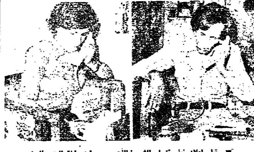
قبل اعلان نيا مقتل الشيخ الذهبي ... ابن وابنة الوزير السابق المحطوف يتابعان اخبار والدهما

« كما واجرينا مباحثات مع اخي وزير الداخلية عضو مجلس قيادة الثورة، تناولنا فيها بالبحث المستفيض علاقاتنا الثنائية، واصفاها بواقع السوية وتعيين صلات الاخوة بين البلدين والاطمئنان من الرغبة في حل المشاكل الملغاة بينهما وخاصة قضية الحدود فقد اتفقا على ما يلي :